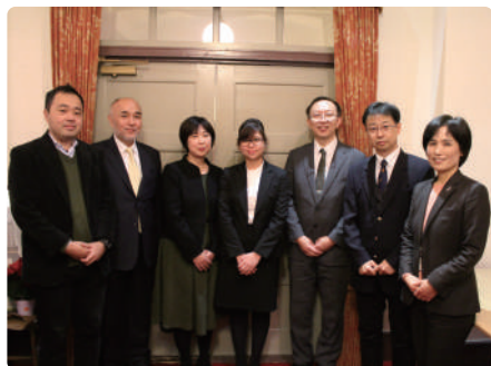
女性が拓く工学の未来賞

優れた研究業績を挙げることが期待される学内の若手女性研究者を表彰し、女性研究者の発掘と育成を図っています。