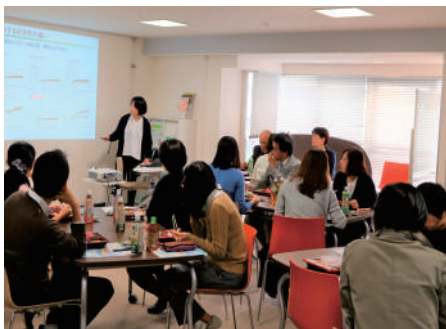
女性研究者・技術者交流会

2016年、全学同窓会の支援により鶴桜会が設立されました。交流会では、専門分野を越えた交流が進んでいます。