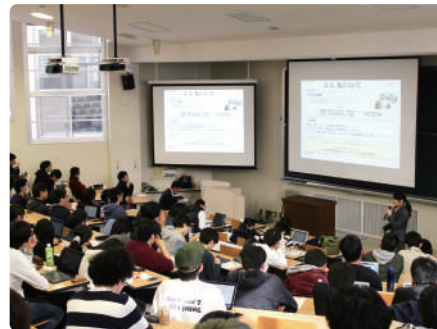
ダイバーシティ教育

女性研究者のネットワーク形成を目的として発足しました。単なる交流をこえて、キャリアアップのための情報交換の場になっています。