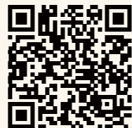
【申込み用二次元コード】

★お問い合わせ先(平日9:00-17:00) 名古屋工業大学ダイバーシティ推進センター 〒466-8555 名古屋市昭和区御器所町 TEL: 052-735-5121 FAX: 052-735-5121 URL: https://diversity.web.nitech.ac.jp/